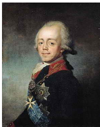
Император Павел I с Мальтийским крестом на груди: Степан Щукин

Средиземное море выходит эскадра под командованием адмирала Федора Ушакова, и совместно с турецким флотом начинаются военные действия. Захватив Ионические острова, русская эскадра плывет дальше и бросает якорь в заливе Неаполя. В ноябре 1798 года император Павел I удостоился титула Гроссмейстера Мальтийского Ордена, а 16 декабря рыцари избирают российского монарха Великим Магистром Мальтийского Ордена. Павел _ официально становится верховным правителем Мальты - маленького, отдаленного, но очень важного стратегически архипелага. Он также становится протектором ордена. Рыцари, бежавшие от Наполеона, находят убежище в России.