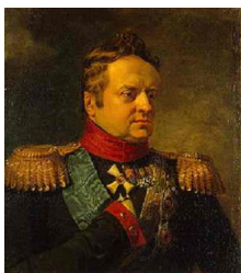
Герцог Александр Вюртембергский: Дж. Доу

Русскими войсками под Данцигом командовал генерал-лейтенант Левиз. В апреле 1813 г. блокаду союзными силами возглавил генерал-от-кавалерии герцог Александр Вюртембергский (родной брат вдовствующей императрицы России Марии Федоровны).