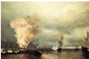
Морское сражение при Выборге 23 июня 1790 года: И. Айвазовский